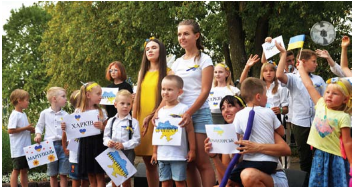
Praėjusių mokslo metų pabaigoje Anykščių A.Baranausko pagrindinę mokyklą lankė apie 60 ukrainiečių vaikų.

Praėjusių mokslo metų pabaigoje A.Baranausko pagrindinėje mokykloje mokėsi apie 60 ukrainiečių. Per vasarą vieni vaikai su tėveliais išvyko į kitas Europos šalis ar į kitus Lietuvos miestus, tačiau į Anykščius at-