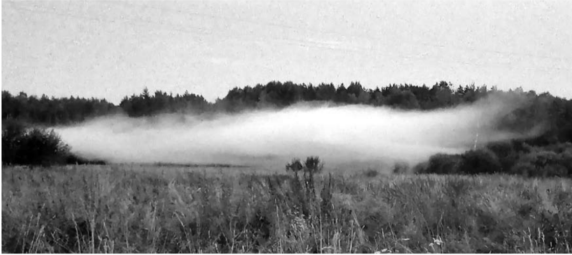
Vienoje iš skundo autorių atsiųstoje nuotraukoje matyti, kaip po „karinių žaidimų“ laukuose tvyro dūmų uždanga.

Gyventojai skundžiasi, kad stovyklautojai ramybės valandomis triukšmauja, o į gyventojų privačias valdas leidžia raketas, kurios gali sukelti gaisrus.