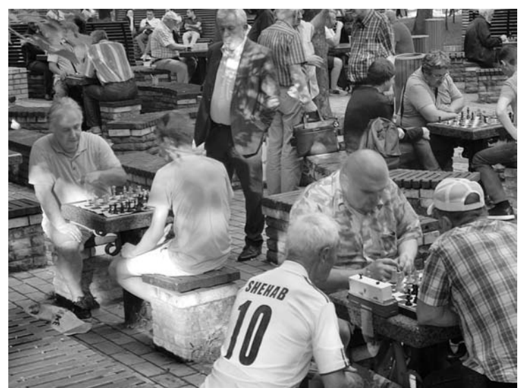
T.Ševčenkos parke renkasi šachmatų entuziastai.