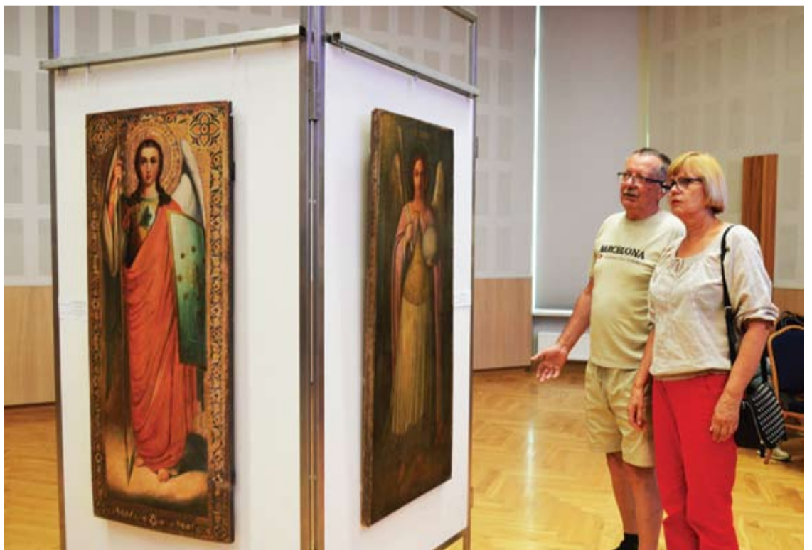
Ikonos Anykščių kultūros centro mažojoje salėje eksponuojamos tik iki šiandien, bet jų ekspoziciją ketinama nuolat keisti.