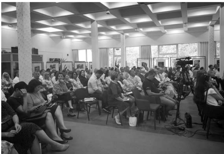
Konferencijoje dalyvavo daugelio šalies savivaldybių vadovai.

Anykščių rajono savivaldybė apie Vidaus reikalų ministrės vizitą žiniasklaidai jokių pranešimų nepateikė.