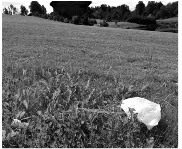
O čia, kaip teigiama, radinys, atskriejęs iš sukarintos vaikų vasaros stovyklos „Geležinis vilkas“.