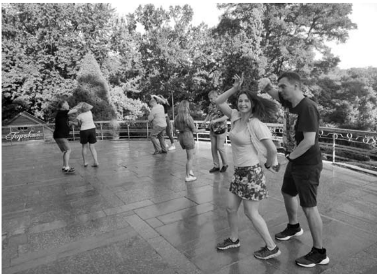
Botanikos sode penktadienio popietę vėl renkasi lotynų šokių gerbėjai.