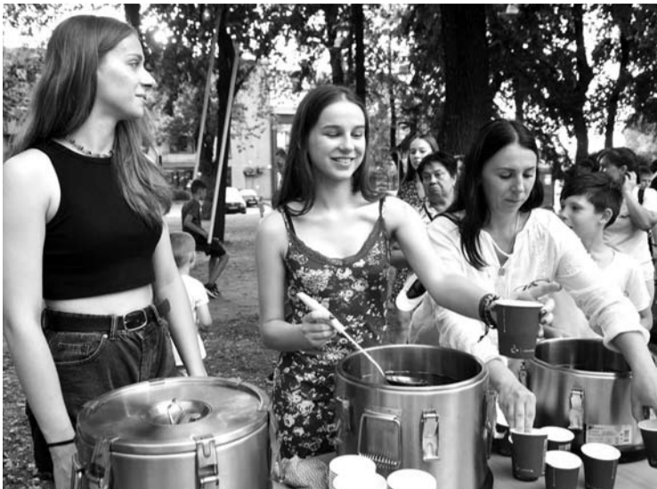
Ukrainos Nepriklausomybės dienos minėjimo dalyviai buvo vaišunami ukrainietiškais valgiais.

Pasak V.Strolios, Anykščiai turi potencialo tapti visos Lietuvos ukrainiečių kultūros centru.